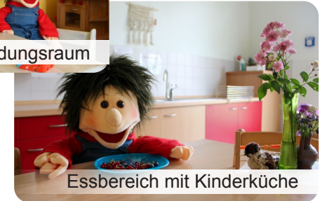
Essbereich mit Kinderküche