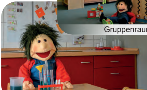
Projektraum mit Kinderküche